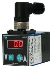
KLV5 - M12