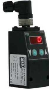
FL5 - M12