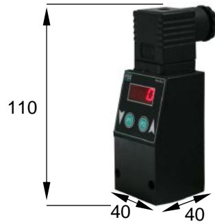
FL5 - M3

Su richiesta: Esecuzione con display in PSI